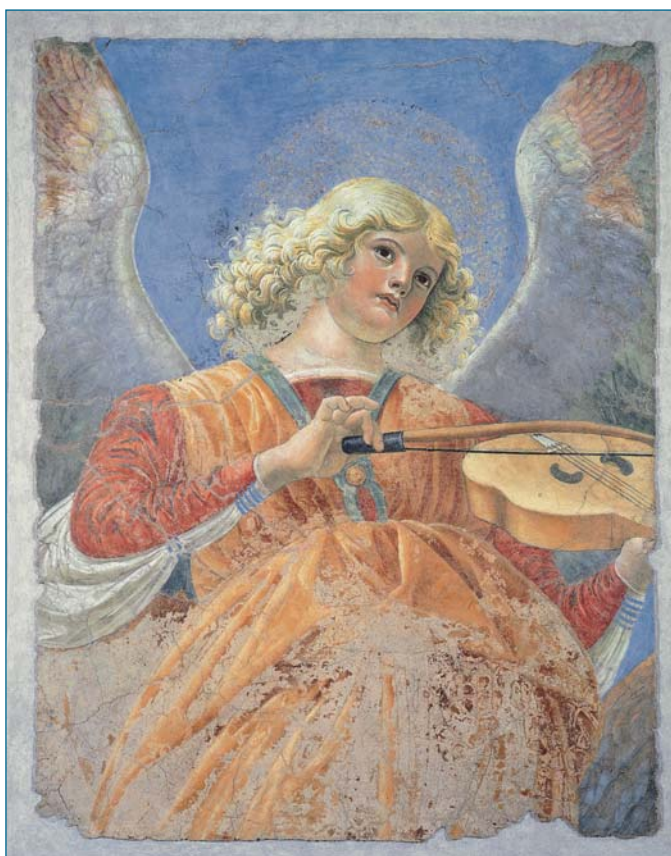
Melozzo da Forlì (Forlì 1438-1494) Angelo che suona la viola , affresco staccato (114x91 cm), Città del Vaticano, Musei Vaticani