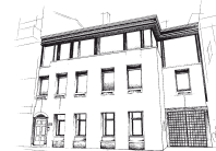
Fondazione Cassa di Risparmio di Bra