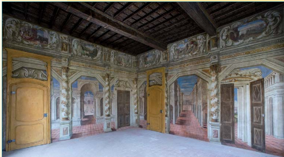
Veduta del Palazzo e di una sala interna del piano nobile

In occasione della redazione di tale documento la fondazione ha sottoscritto una convenzione con il Comune di al fine di procedere al restauro del Palazzo per il suo riutilizzo funzionale e la possibilità per la Fondazione di fruire di alcuni locali per anni 50 dalla conclusione dei lavori.