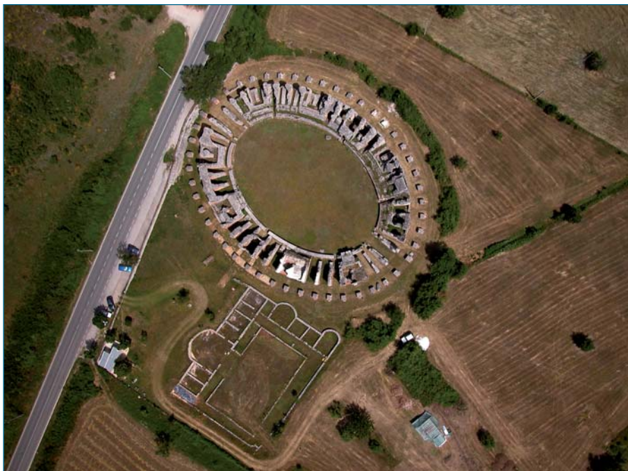
L'anfiteatro della città di Amiternum

mese di agosto e in concomitanza con le manifestazioni della Perdonna Celestianiana dell'Aquila. La settimana di cultura e spiritualità legata alla figura di Papa Celestino V. "Con questa operazione - aggiunge il Presidente - la Fondazione Carispaq si pone al fianco degli uffici, Direzione Regionale e Soprintendenze, che si occupano di tutela e valorizzazione dei beni culturali collaborando nel recupero di opere d'arte e di testimonianze della nostra storia che sempre più spesso giacciono invisibili nei magazzini dei musei".