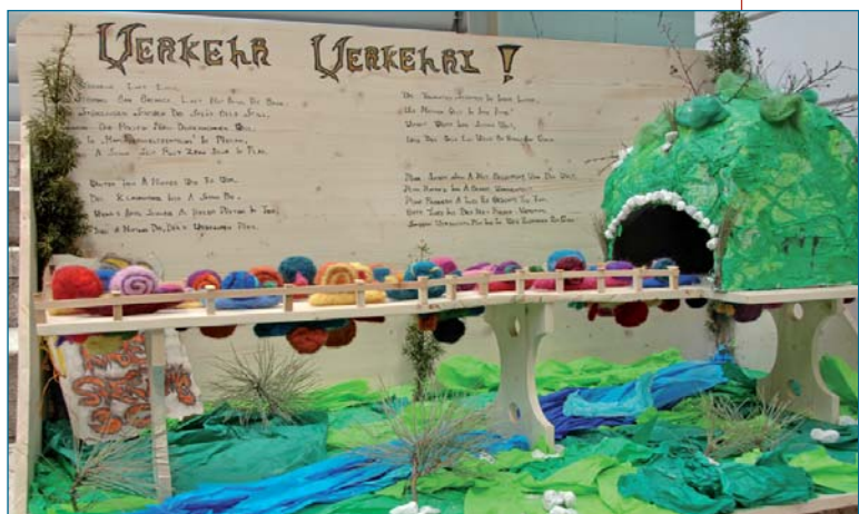
Progetto della classe 3C scuola Mariengarten di Vipiteno

Un concetto ambizioso e sorprendente. Il punto di partenza infatti per il progetto della 2C è la lezione di fisica e la realizzazione si effettua ad ampio respiro, implicando più materie. Si aggiungono infatti la matematica, l'arte, la psicologia/pedagogia,