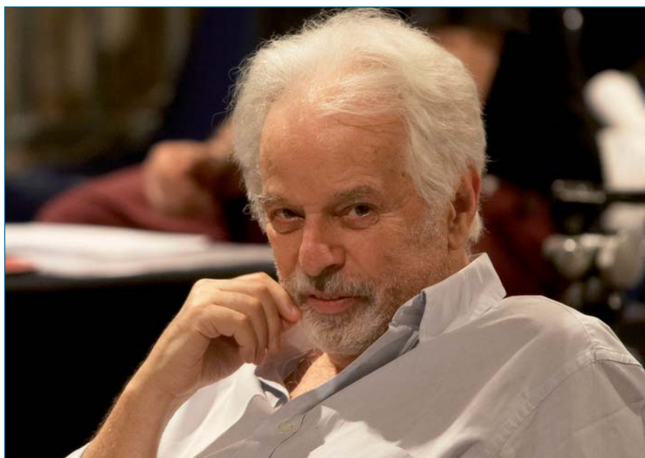
Alejandro Jodorowsky autore dello spettacolo "Il sogno senza fine"

La manifestazione offre visibilità a compagnie emergenti italiane ed europee e consente al pubblico di vivere emozioni intense con artisti di livello internazionale. ■