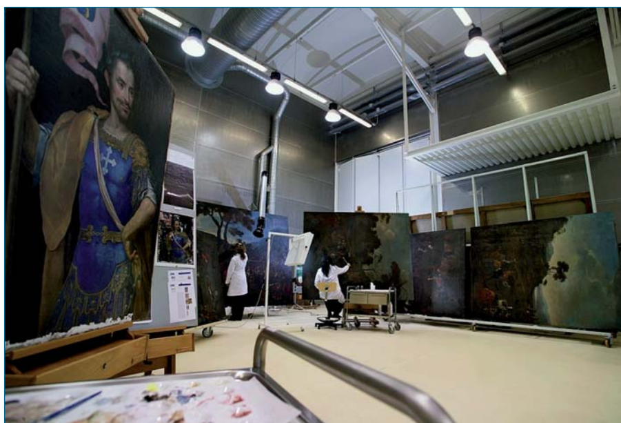
Laboratorio di restauro, Centro Conservazione e Restauro "La Venaria Reale"

tico; inoltre, agli studenti sarà offerta l'opportunità di partecipare a stage in Egitto presso cantieri di scavo a Luxor e Alessandria. È rivolto a ricercatori italiani e stranieri laureati in discipline umanistiche. È un corso unico nel suo genere in Europa, poiché affianca la didattica delle scienze filologiche a quella delle scienze archeologiche e storiche della disciplina. Sono ammessi 15 partecipanti selezionati attraverso un colloquio e l'esame del curriculum, con un impegno da gennaio 2009 a giugno 2010 e una spesa di 3 mila euro. Invio domanda e curriculum vitae entro il 30 novembre 2008.