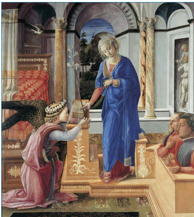
Filippo Lippi (Firenze 1406 circa - Spoleto 1469) Annunciazione con due devoti , olio su tavola, (155x144 cm) Roma, Galleria Nazionale d'Arte Antica, Palazzo Barberini

Il ritorno del papato sulle rive del Tevere, dopo la parentesi avignonese, infatti, aveva restituito alla città dei